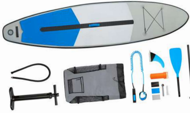
1 Tabla inflable de paddle con accesorios