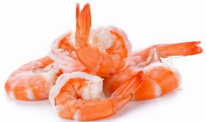
1000 Camarones jumbo frescos