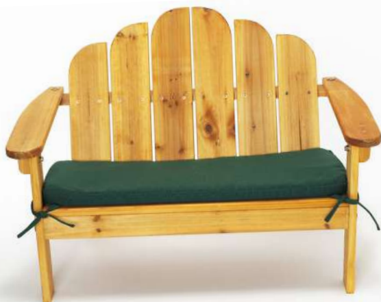
1 Silla Adirondack gigante de cedro