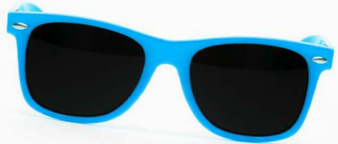
1000 Pares de lentes de sol baratos