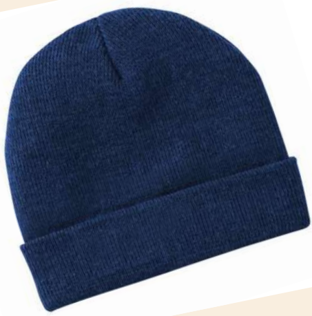
1 Gorro de lana