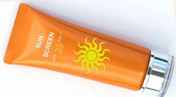
1,000 Onzas de protector solar