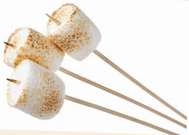
1000 Malvaviscos asados